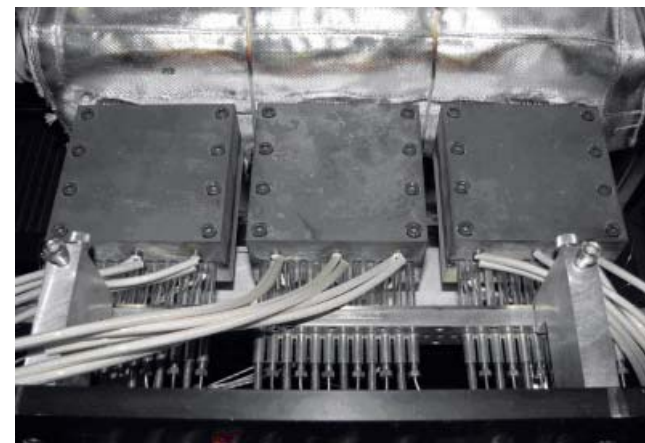
Abb. 2. Multireaktormodul zur parallelisierten Katalysatorausprüfung

Am ersten Tag wird im Rahmen von Vorträgen ein Überblick über verschiedene Methoden der Katalysatorausprüfung gegeben sowie Lösungsansätze für reaktionstechnische Fragestellungen vorgestellt. Im Anschluss erfolgt eine Laborbesichtigung. Danach wird an drei Praktikumstagen für ca. acht Stunden im Labor gearbeitet, wobei in Gruppen von max. 3 Teilnehmern stationsweise die im Kursprogramm genannten Experimente durchgeführt werden.